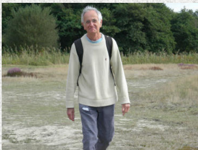
Un observateur avisé rejoint le groupe