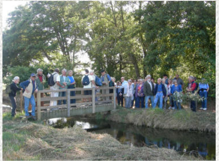
Le petit pont de bois sur le déversoir de l'étang