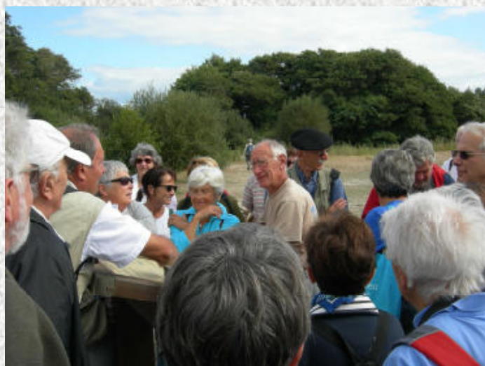
Des questions pour un champion