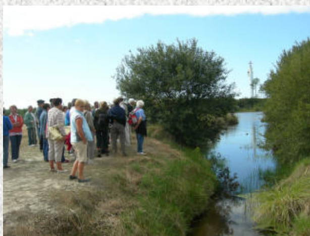
Le bassin dessableur, l'étang et le sémaphore