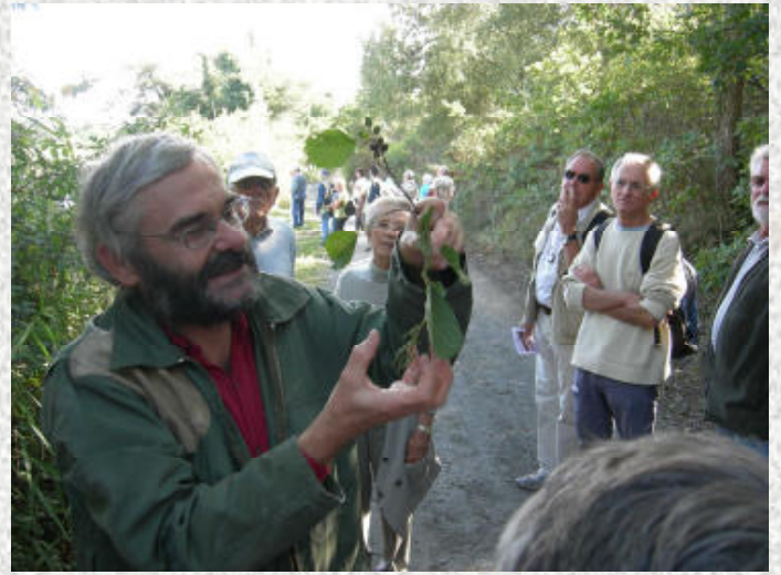
Bruno nous dévoile la sexualité de l'Aulne