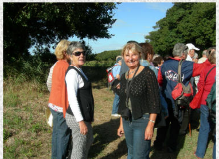
Un hommage mérité à notre photographe Pascaline