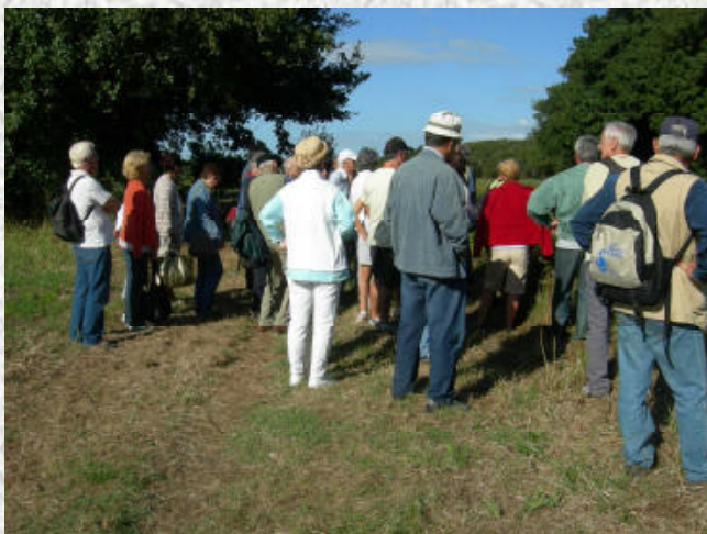
On découvre l'invasion du courant par la Jussie