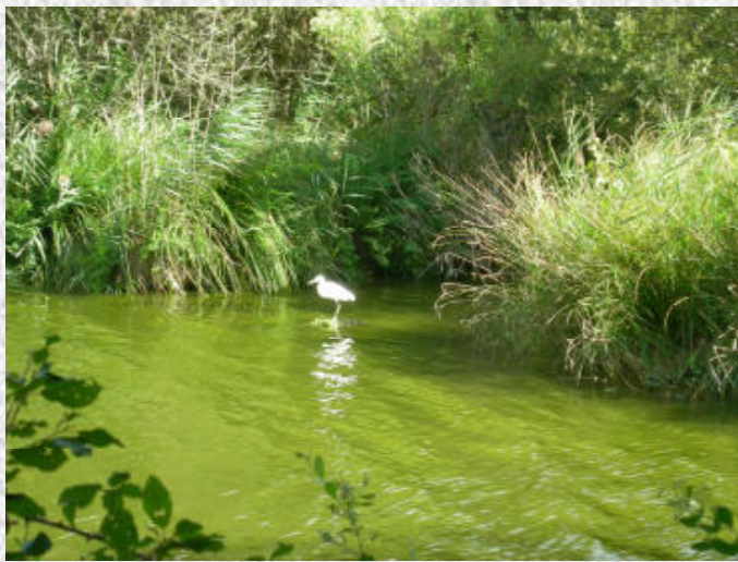
Une aigrette surprise avant son envol