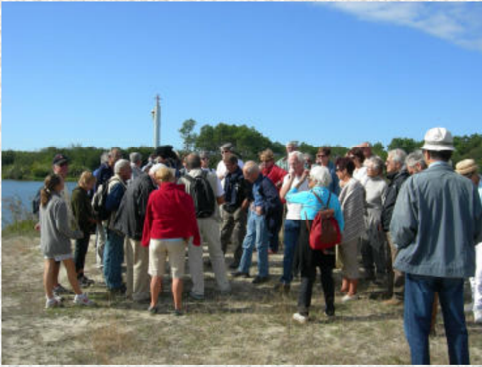
Des commentaires sur l'ancien havre de l'Adour